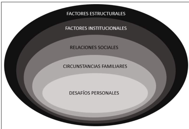
Figura 1. Factores de riesgo del abandono educativo temprano.

Las contribuciones de Bronfenbrenner (1979), Brown (2014), Díaz-Vicario y otros (2019) y Brown y otros (2021), nos permiten categorizar hasta cinco grupos de factores de riesgo interrelacionados e interdependientes (ver Figura 1) alrededor de los desafíos personales, las circunstancias familiares, las relaciones sociales, los factores institucionales y los factores estructurales.