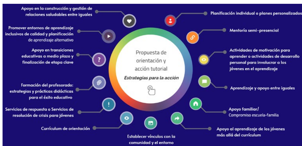
Gráfica 1. Estrategias para evitar el abandono temprano en jóvenes.

Cada estrategia de las mencionadas se acompaña de una ficha que identifica la estrategia (prevención, intervención o compensación), se vincula a determinados factores de riesgo y la sitúa en un marco determinado de intervención (nivel individual, nivel institucional o nivel del sistema educativo). Igualmente delimita sus objetivos, la describe de manera detallada, identifica los beneficiarios, los aplicadores, el momento y coste de la aplicación (bajo, medio o alto), da orientaciones para su desarrollo y presenta recursos vinculados y otros elementos de referencia. El contenido de muchos de estos apartados puede verse sintéticamente en el ejemplo presentado en el cuadro 1.y que hace referencia a la adaptación de una de las estrategias a centros de Formación profesional (objeto del Proyecto Orienta4Vet).